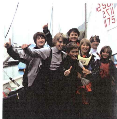
DAS OPTI TEAM ZENTRALSCHWEIZ

bildeter und vom Verein angestellter Segeltrainer. Dank höherer Mitgliederzahlen, grösserer Finanzkraft und oftmals integrierter Segelschulen ist dies für sie auch finanzierbar. Im deutschsprachigen Raum hingegen basiert Juniorenarbeit auf freiwilligem Einsatz. Engagierte Vereinsmitglieder führen Trainings durch, kümmern sich um das Material und begleiten den Nachwuchs bei Regatten. Die Eltern spielen dabei eine entscheidende Rolle. Sie amten als Fahrer, Betreuer, Helfer und sind ständig vor Ort. Doch stossen solche Konzepte bezüglich Leistungsfähigkeit, Kontinuität und Know-how an ihre Grenzen. Wenn Junioren heute national oder gar international erfolgreich sein sollen, dann reicht die enthusiastische Herangehensweise eines ehrenamtlichen Trainers nicht mehr. Die Kompetenzen und die zeitliche Flexibilität eines fest angestellten und solid ausgebildeten Coachs sind mittlerweile unabdingbar geworden. Deutlich wird dies anhand der klar zu Tage getretenen Niveauunterschiede zwischen den Junioren der beiden Sprachregionen.