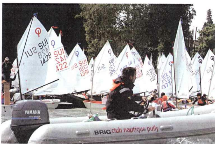
IN DER WESTSCHWEIZ SETZT MAN SCHON LANGE AUF PROFESSIONELLE JUNIORENTRAINER.

In der Deutschschweiz kümmern sich traditionellerweise Ehrenamtliche um die clubinterne Ausbildung der Junioren. Bei Regatten sind die jungen Segler aber nicht mehr konkurrenzfähig. Es wurden jedoch bereits verschiedene Konzepte zur Professionalisierung des Juniorenwesens entwickelt.